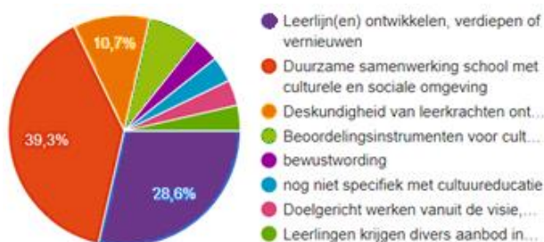
Figuur 4: Waar willen jullie als school de komende 2 jaar op gaan richten op het gebied van cultuureducatie?

De scholen willen zich de komende twee jaar vooral gaan richten op het aangaan van een duurzame samenwerking met de culturele en sociale omgeving en het ontwikkelen, verdiepen of vernieuwen van leerlijnen.