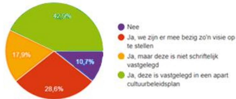
Figuur 2: Is er sprake van een samenhang in de culturele activiteiten?