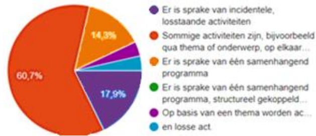
Figuur 3: In hoeverre komen jullie toe aan het volgen van de culturele ontwikkeling van leerlingen?

Toch is het iets wat veel scholen bezighoudt. 67,9 procent van de scholen geeft aan met een doorlopende leerlijn cultuur bezig te zijn of ermee te werken.